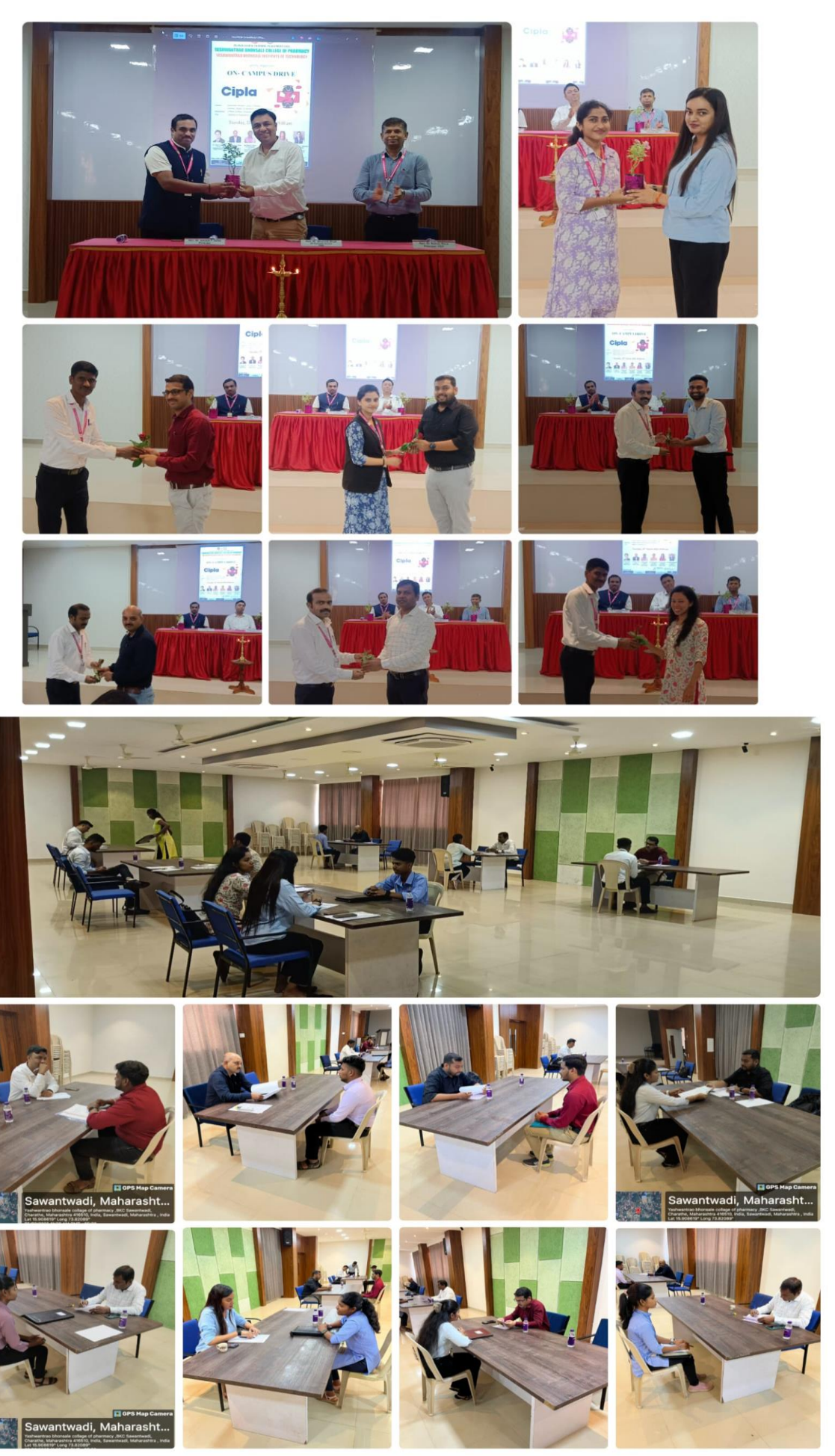
Interview session held by HR Team and Discussion with selected students by HR team