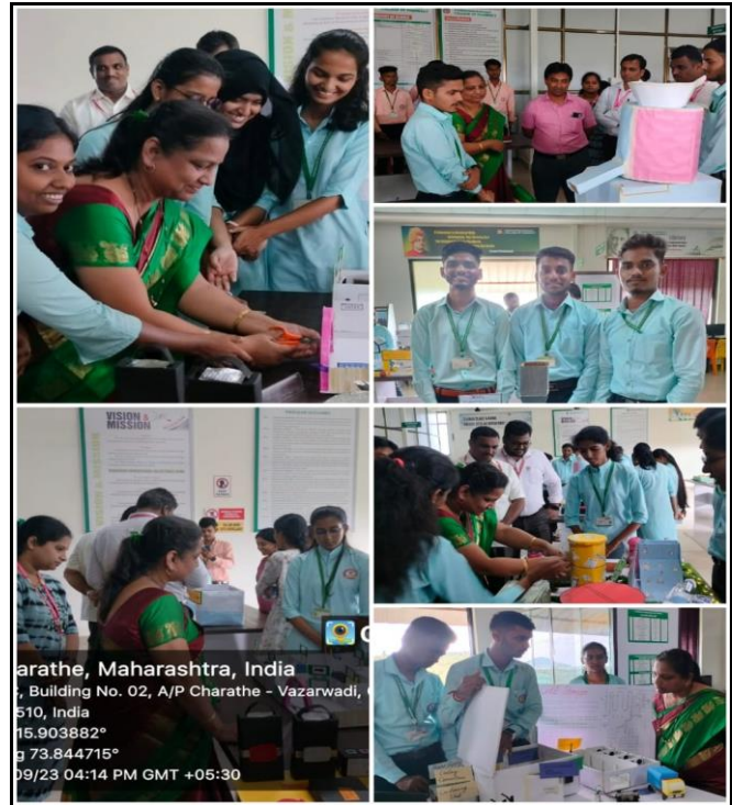
Industry Model Making Competition