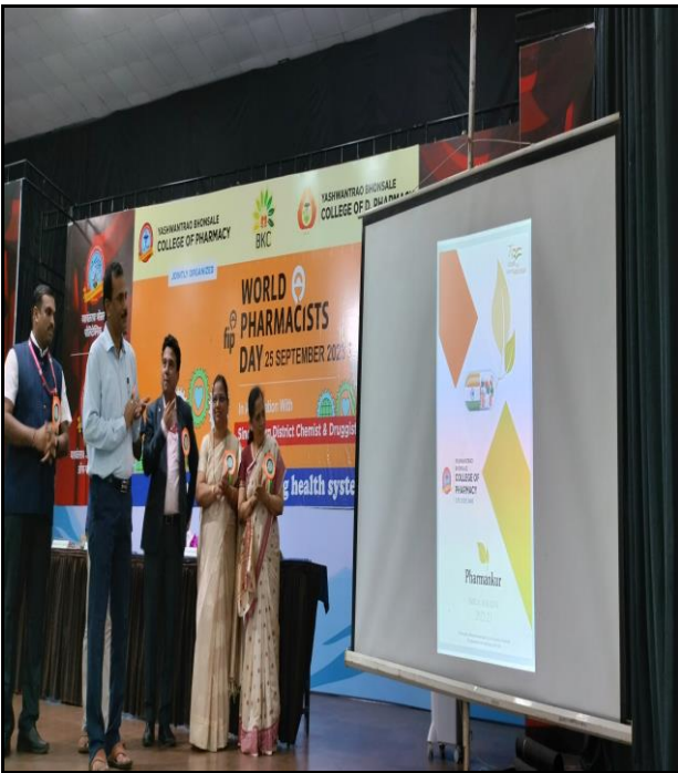
Inauguration of E-Magazine “Pharmankur” and Newsletters “Pharmaphile” & “Pharmatweet”