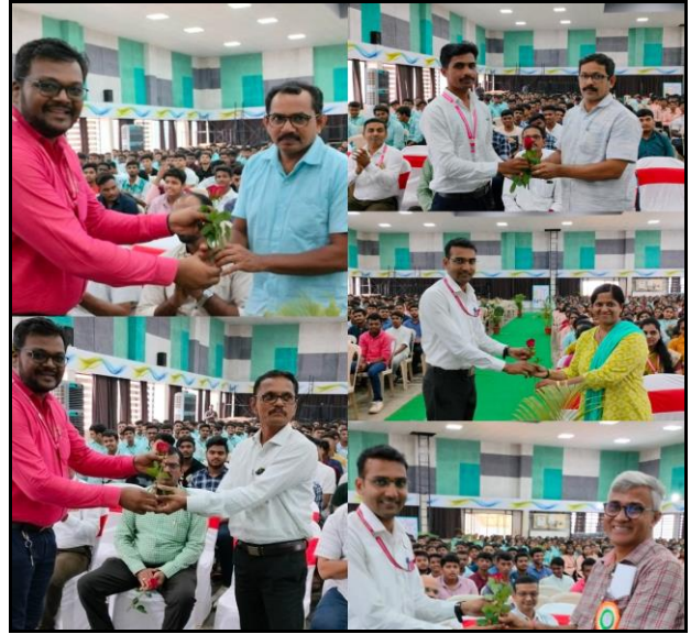
Felicitation of Local Pharmacist