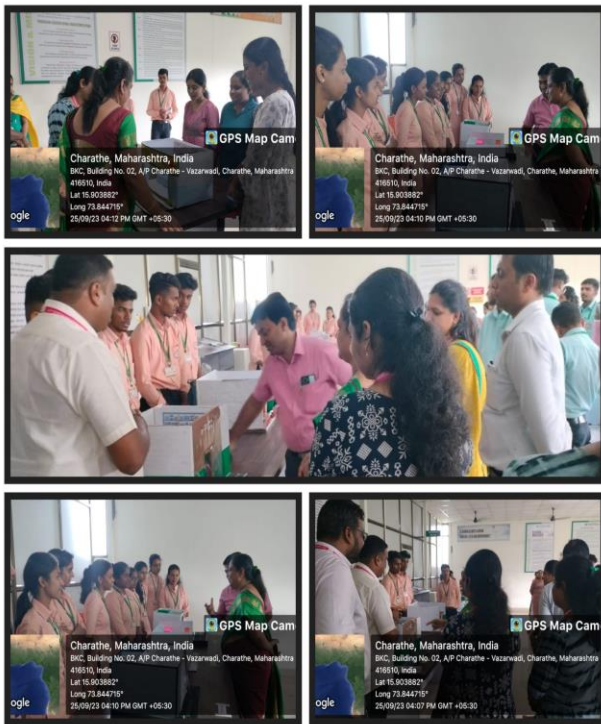
Retail Pharmacy Model Making Competition