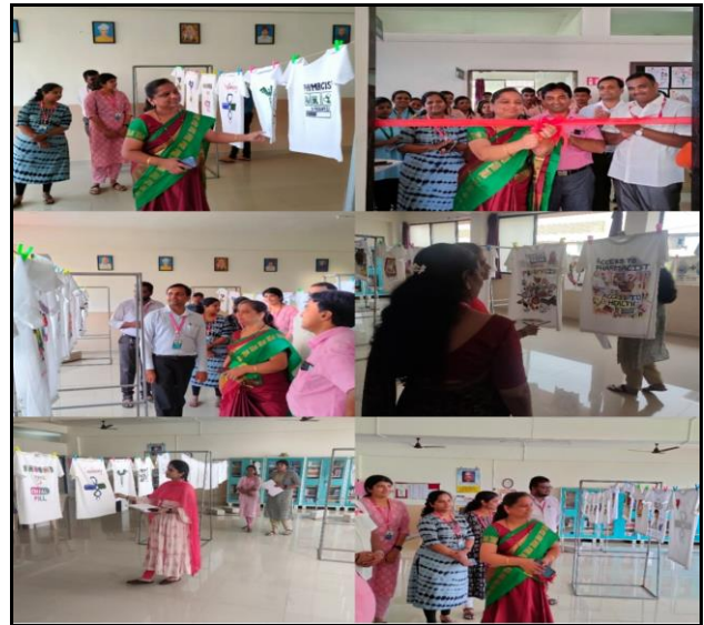
T-Shirt Painting Competition