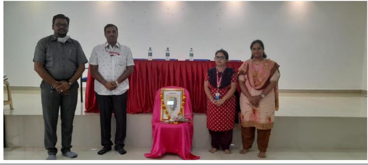
कार्यक्रमाचे उद्घाटन कुसुमाग्रजांच्या प्रतिमेला पुष्पहार घालून करण्यात आले.