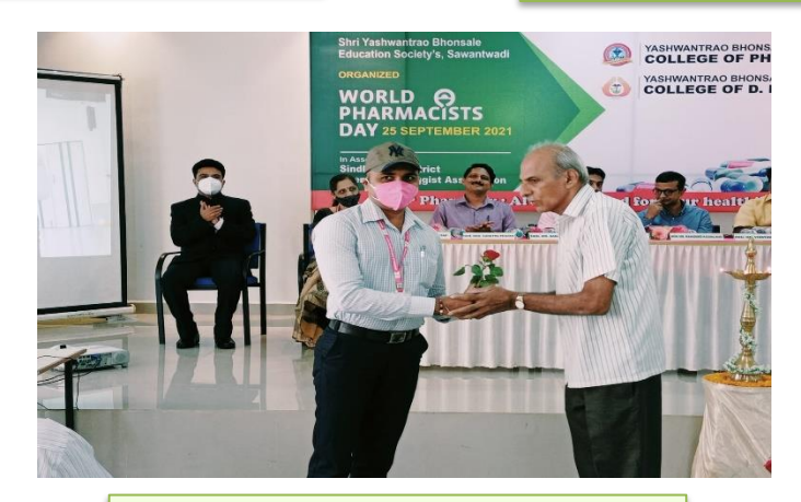
Felicitation of Local Pharmacists