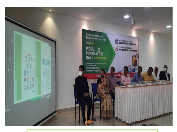
Inauguration of E-Magazine "Pharmankur"