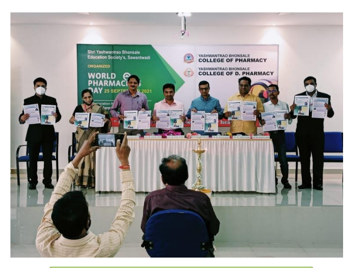
Inauguration of Newsletter "Phramaphile" & "Pharmatweet"