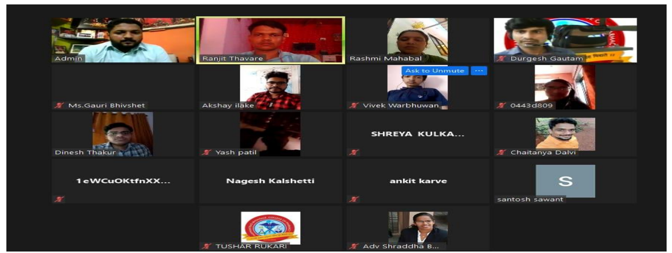
Glimpses of College level participation

Total 13 participants expressed their view in open level competitions on the subject selected. The elocution of the same was evaluated by Mr.Durgesh Gautam , Ms. Gauri Bhivshet and Ms.Rashmi Mahabal on following points.