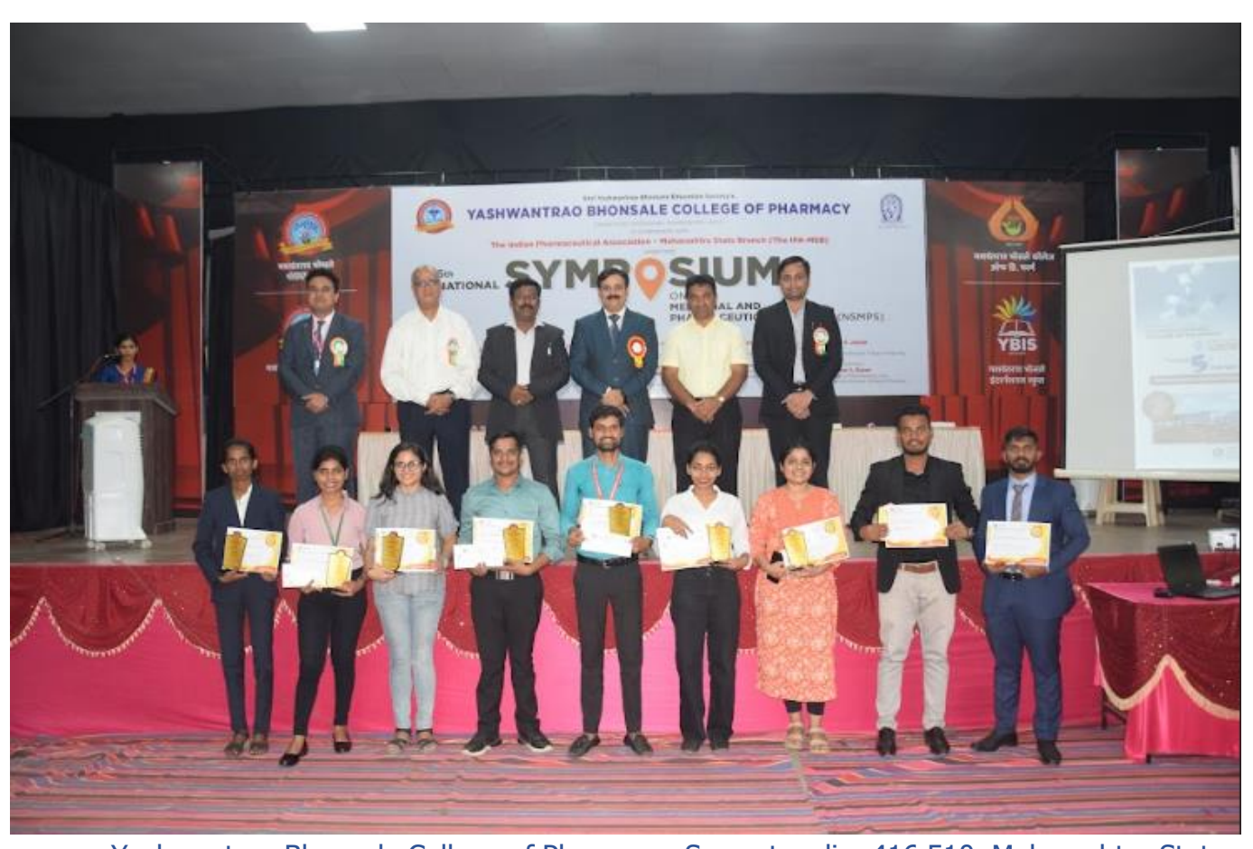
Yashwantrao Bhonsale College of Pharmacy, Sawantwadi – 416 510, Maharashtra State